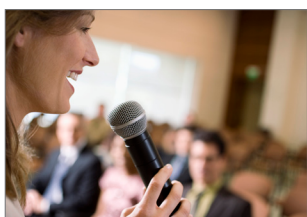
Salę wykładowe i konferencyjne