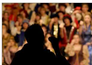
Wszelkie aplikacje związane z głosem